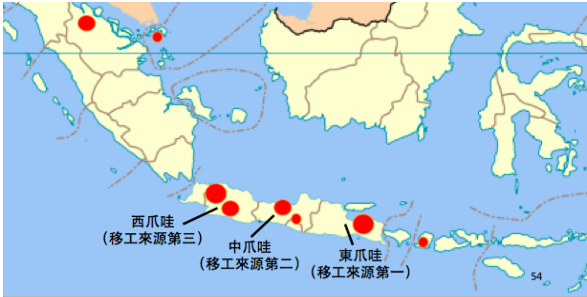
圖 2 印尼台商人力需求地圖