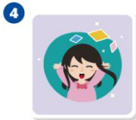
大風吹 x 2 張