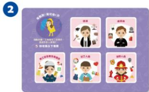
情境圖板 x 8 片