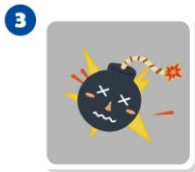
炸彈 x 2 張