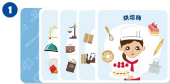
職業卡 x 40 張